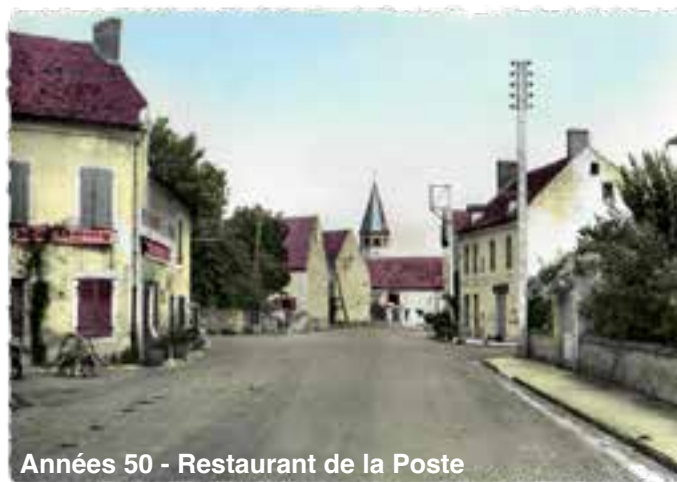
Années 50 - Restaurant de la Poste